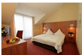
Komfort Zimmer I